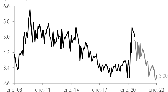
Tasa de desempleo %, cifras originales

Nota: Las líneas punteadas corresponden a las cifras de la encuesta telefónica. La línea gris corresponde a la nueva versión de la ENOE.