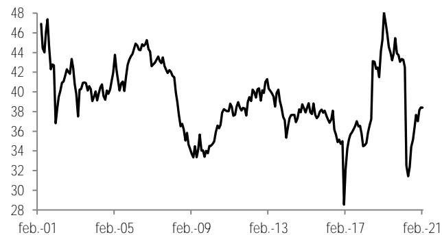
Confianza del consumidor Indicador, cifras ajustadas por estacionalidad

*Nota: Las diferencias pueden no cuadrar por redondeo