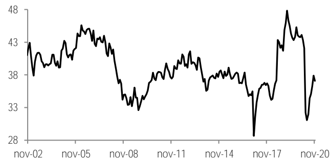
Confianza del consumidor Indicador, cifras ajustadas por estacionalidad