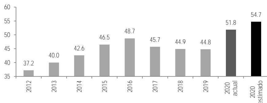
Saldo Histórico de los Requerimientos Fiscales del Sector Público % del PIB