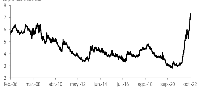
Tasa de interés en créditos a tasa fija de 30 años %, promedio nacional